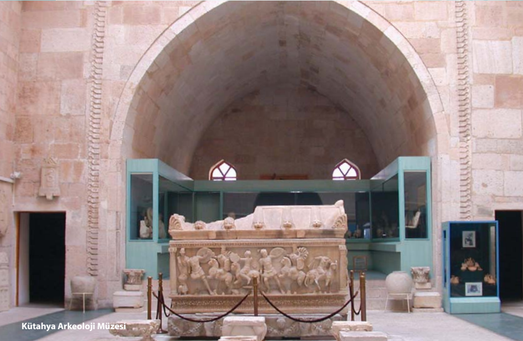
Kütahya Arkeoloji Müzesi

Büyük Önder Gazi Mustafa Kemal ATATÜRK " Ey Yükselen Yeni Nesil ! İstikbal Sizsiniz, Cumhuriyeti Biz Tesis Ettik, Onu İla ve İdame Edecek Sizsiniz." veciz sözünü Zafertepe Çalköy'de, "Ordular İlk Hedefiniz Akdeniz'dir İleri!" emrini Dumlupınar'da vermiştir.