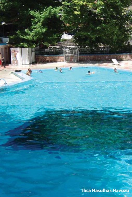
Ilıca Hasulhas Havuzu

Ilıca Mesire Alanı, Sarıkız Mağarası, Porsuk Barajı, Türkmen Dağı. Frigya Vadilerine 30 dk, Aizanoi Antik Kentine 45 dk mesafededir. Kütahya Arkeoloji Müzesi, Çini Müzesi, Lajos Kossuth Müzesi (Macar Evi) , Anadolu Kültür Sanat ve Arkeoloji Müzesi, Jeoloji Müzesi , Kent Tarihi Müzesi, Dumlupınar Üniversitesi Müzesi, Milli Mücadele Müzesi