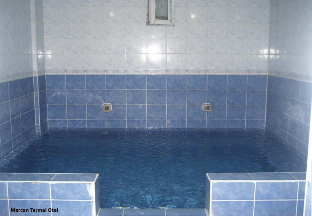
Mercan Termal Otel