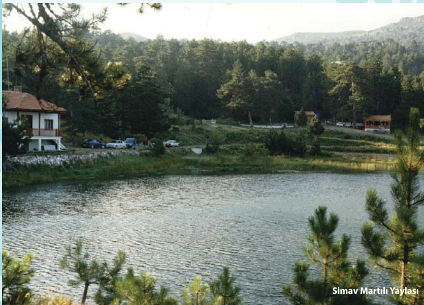
Simav Martlı Yaylası