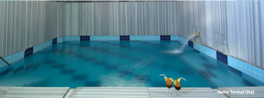
Nehir Termal Otel