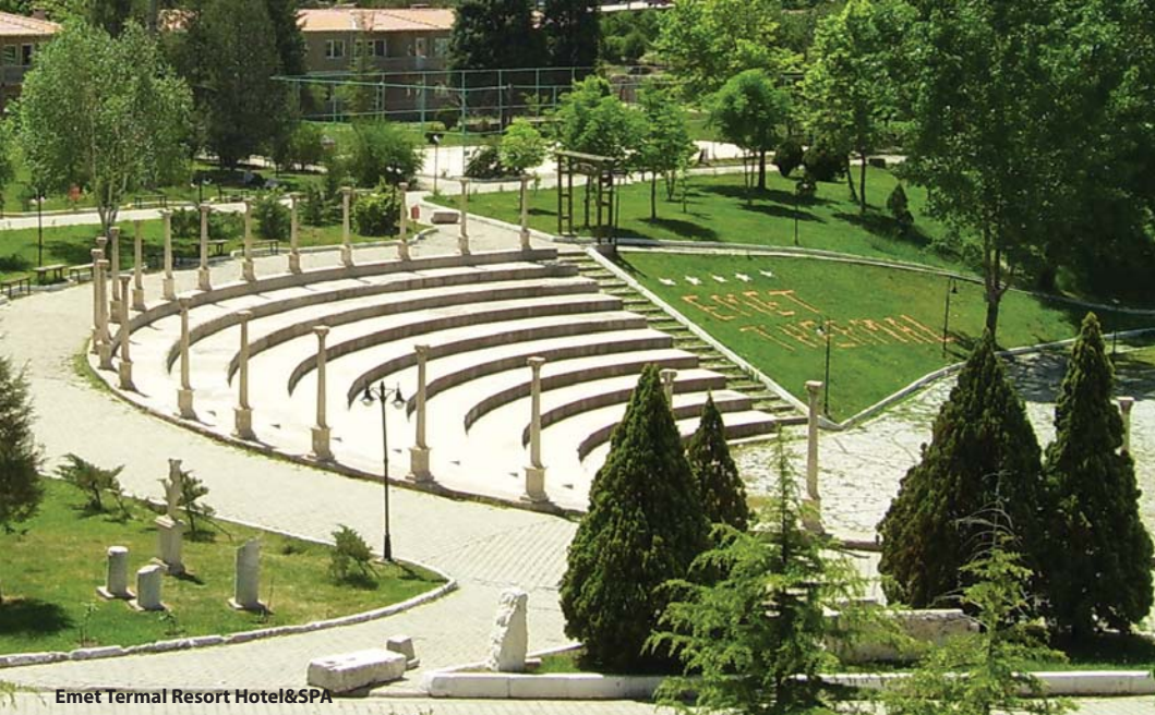
Emet Termal Resort Hotel&SPA