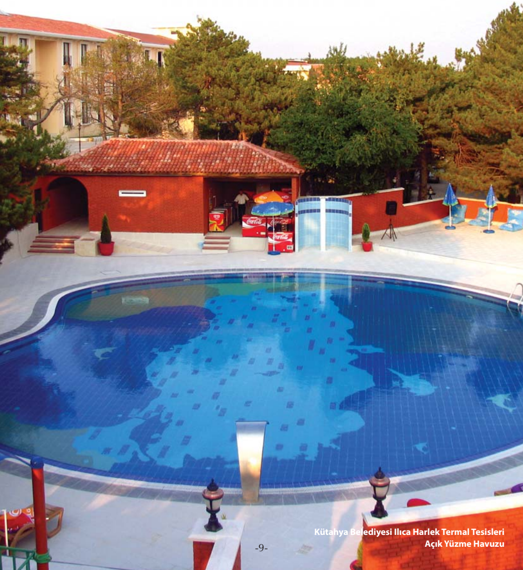
Kütahya Belediyesi İlica Harlek Termal Tesisleri Açık Yüzme Havuzu