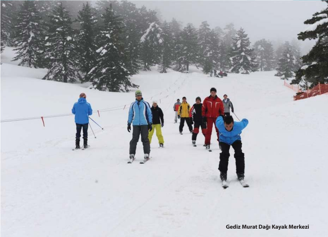
Gediz Murat Dađı Kayak Merkezi

Murat Dađı Termal Tesisleri 0 274 412 74 96