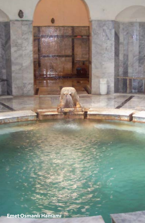
Emet Osmanlı Hamamı

Ege Bölgesinin graben sistemi ve bunu oluşturan kırıklar üzerinde yer alan Kütahya jeotermal kaynaklar açısından ülkemizin en zengin illerindedir. Bu nedenle Kütahya'ya Termal Turizmin başkenti de denilebilir. Zira Türkiye de Bakanlar Kurulu Kararı ile ilan edilen 80 Termal Turizm Merkezinden 8 tanesi Kütahya'da bulunmaktadır.