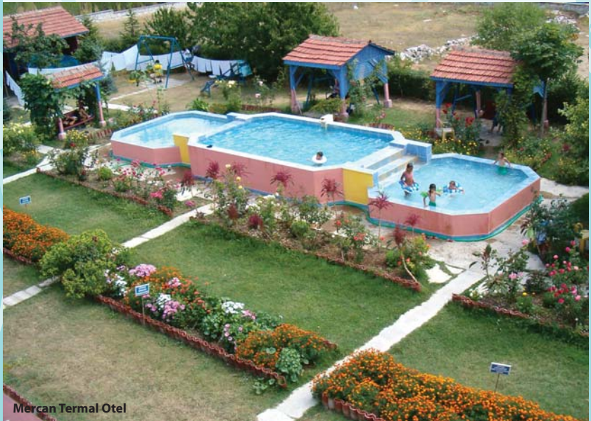
Mercan Termal Otel