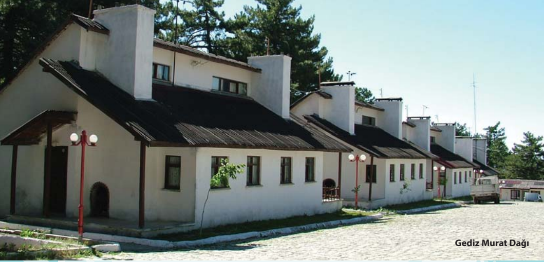
Gediz Murat Dađı

KONUMU: Murat Dađı'nın sık bir orman örtüsüyle kaplı 1450'nci metresinde yer alan kaplıca, Gediz'e 30 km uzaklıktadır.