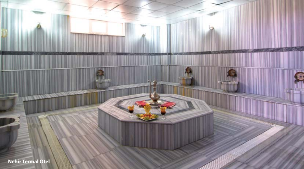
Nehir Termal Otel