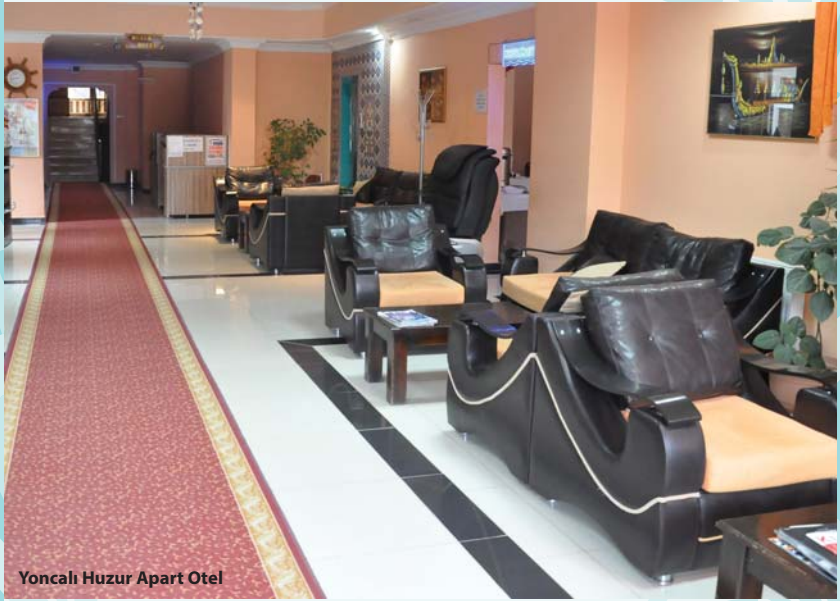
Yoncalı Huzur Apart Otel