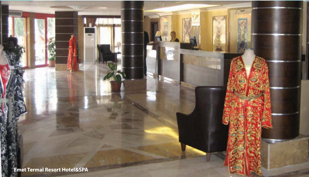
Emet Termal Resort Hotel&SPA