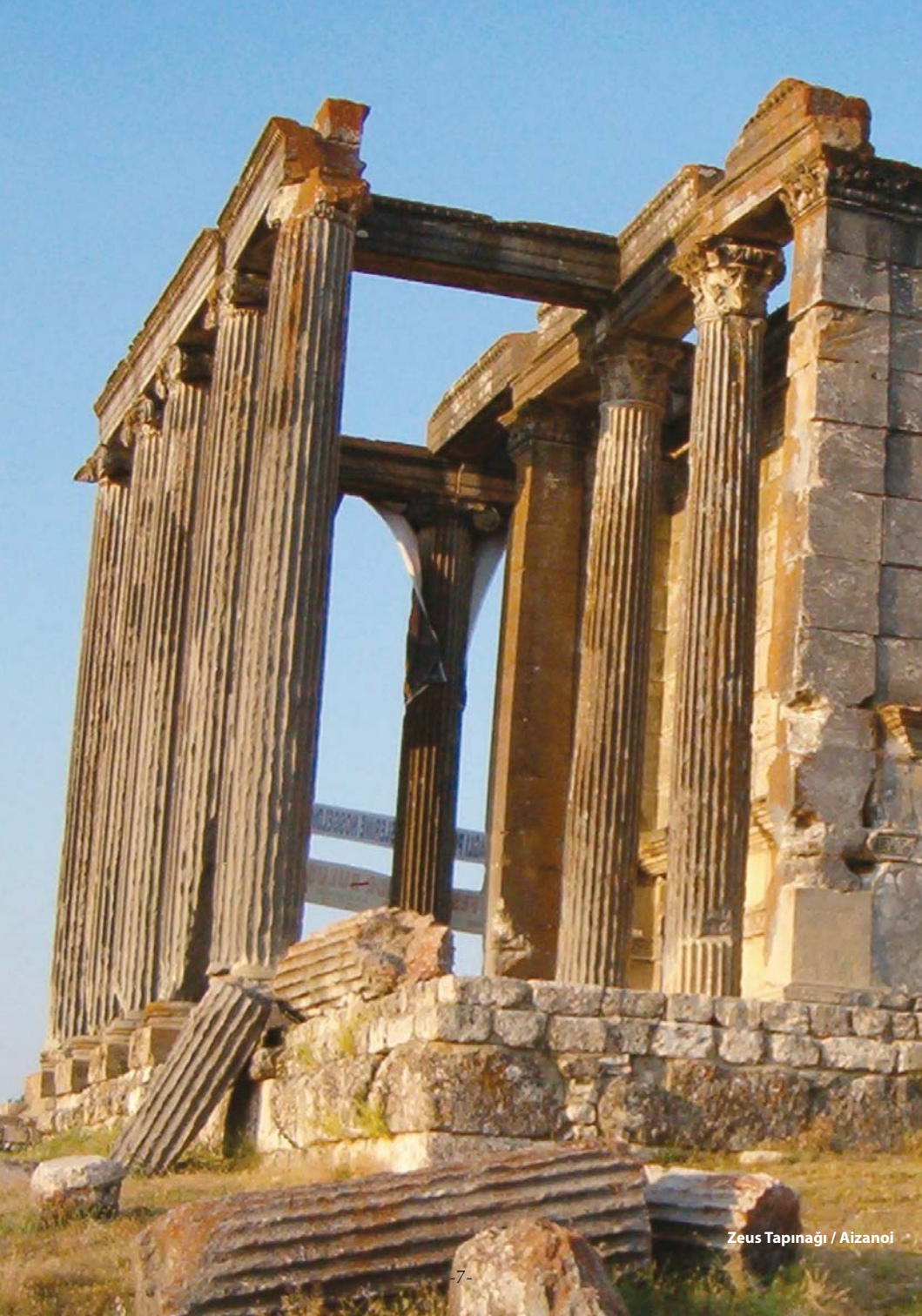
Zeus Tapınağı / Aizanoi