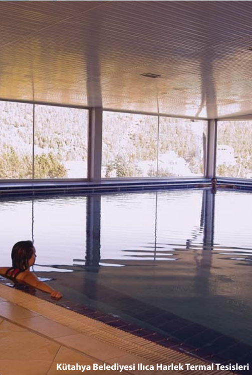
Kütahya Belediyesi Ilıca Harlek Termal Tesisi