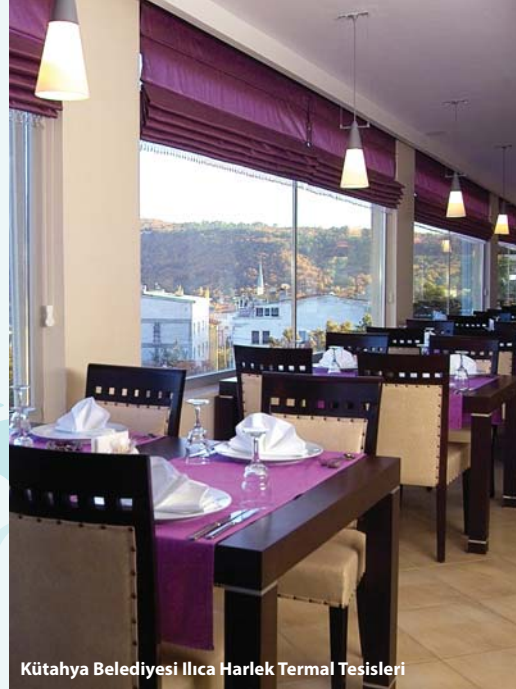
Kütahya Belediyesi Ilıca Harlek Termal Tesisleri

HASTALIKLAR: Sağlık Bakanlığı İşletme Ruhsatında bu suların balneolojik açıdan başlıca şu hastalıklar için etken olduğu belirtilmektedir.