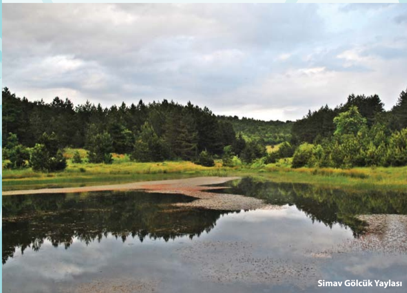
Simav Gölcük Yaylası